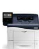
Stampante a colori Xerox® VersaLink® C400