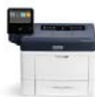
Stampante Xerox® VersaLink® B400