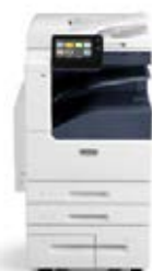
Stampante multifunzione a colori Xerox® VersaLink® C7020/C7025/C7030