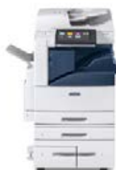
Stampante multifunzione a colori Xerox® AltaLink® C8030/C8035/C8045/ C8055/C8070