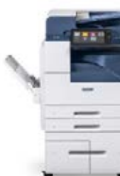
Stampante multifunzione Xerox® AltaLink® B8045/8055/8065/ 8075/8090